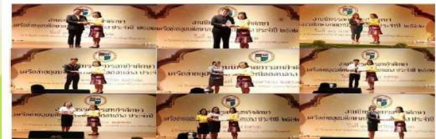
รางวัลผลงานสหกิจศึกษาดีเด่นระดับเครือข่ายภาคเหนือตอนล่าง ประจำปี 2562