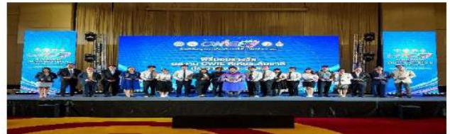
รางวัลผลงานสหกิจศึกษาดีเด่นระดับชาติ ประจำปี 2567 ในงานวันสหกิจศึกษาบูรณาการกับการทำงาน ครั้งที่ 14