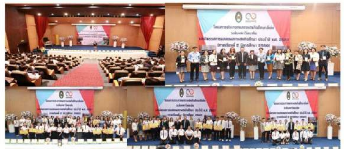
การนำเสนอผลงานสหกิจศึกษาดีเด่นระดับมหาวิทยาลัย