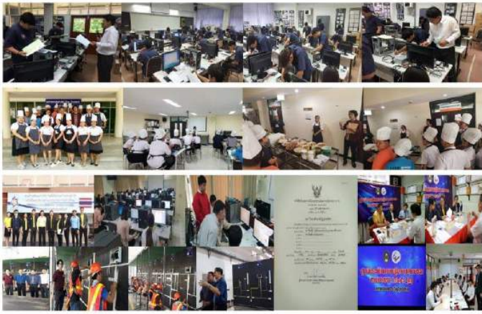
นักศึกษาได้รับหนังสือรับรองความรู้ความสามารถและหนังสือรับรองมาตรฐานฝีมือแรงงานแห่งชาติ