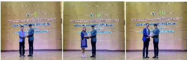
รางวัลผลงานสหกิจศึกษาดีเด่นระดับเครือข่ายภาคเหนือตอนล่าง ประจำปี 2567