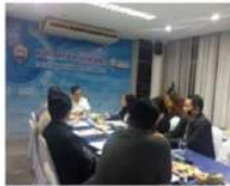
หอการค้าจังหวัดอุดรดิตต์