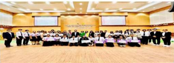
รางวัลผลงานสหกิจศึกษาดีเด่นระดับเครือข่ายภาคเหนือตอนล่าง ประจำปี 2567