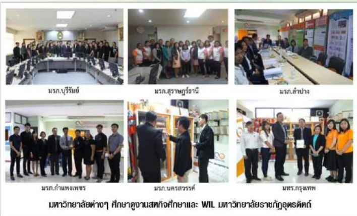
มหาวิทยาลัยต่างๆ ศึกษาฐานสทกิจศึกษาและ WIL มหาวิทยาลัยราชภัฏอุดรดิตถ์