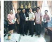
สำนักงานพัฒนาฝีมือแรงงานจังหวัดอุดรดิตต์