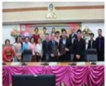
MOU ด้านสหกิจศึกษา กับสถานประกอบการ