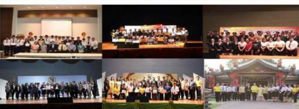
รางวัลผลงานสหกิจศึกษาดีเด่นระดับชาติและระดับเครือข่ายภาคเหนือตอนล่างของมหาวิทยาลัยราชภัฏอุดรดิตถ์