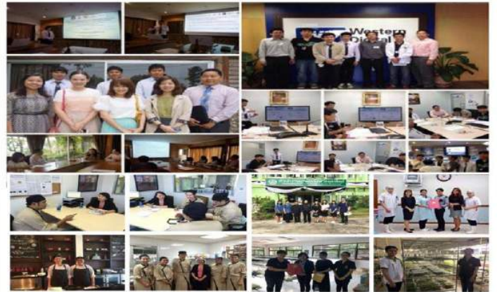
การนิเทศงานสหกิจศึกษาของมหาวิทยาลัยราชภัฏอุดรดิตต์ตามมาตรฐานสหกิจศึกษาของสมาคมสหกิจศึกษาไทย

มหาวิทยาลัยราชภัฏอุดรดิตต์ได้มีการกำกับการนิเทศงานและการนำเสนอผลงานสหกิจศึกษา ใต้กรอบงานคุณภาพมากขึ้น โดยการจัดประชุมแลกเปลี่ยนเรียนรู้สร้างความรู้และแนวทางการปฏิบัติงานสหกิจศึกษาได้ประสบความสำเร็จให้กับผู้บริหารระดับคณะ อาจารย์นิเทศ นักศึกษาและสถานประกอบการ เพื่อเป็นการต่อยอดและพัฒนาผลงานโครงการสหกิจศึกษานักศึกษามีคุณภาพและได้รางวัลสหกิจศึกษาดีเด่นอย่างต่อเนื่อง