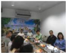
สภาอุตสาหกรรมจังหวัดอุดรดิตต์

มหาวิทยาลัยราชภัฏอุดรดิตต์ได้มีการสร้างความร่วมมือกับสถานประกอบการและหน่วยงาน ผู้ให้บริการด้านวิชาชีพเพื่อรองรับการดำเนินงานสหกิจศึกษาและการจัดการศึกษาเชิงบูรณาการ กับการทำงาน การเตรียมความพร้อมให้กับนักศึกษา และการพัฒนาปรับปรุงหลักสูตรร่วมกับ สถานประกอบการร่วมกันต่อไป