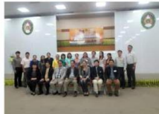
อบรมอาจารย์ที่จังหวัด สกล. สกล. สกล. สกล. สกล.