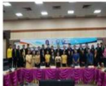
MOU กับสภาอุตสาหกรรมและหอการค้า