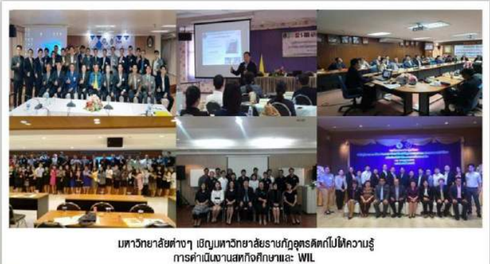
มหาวิทยาลัยต่างๆ เชิญมหาวิทยาลัยราชภัฏอุดรดิตถ์ไปให้ความรู้ การดำเนินงานสทกิจศึกษาและ WIL