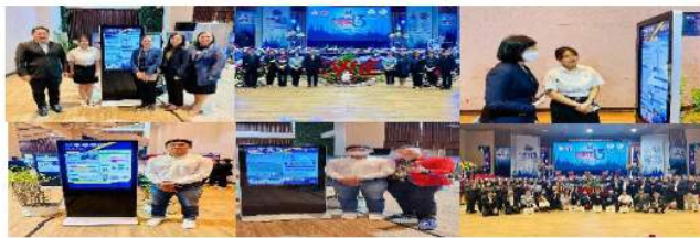
รางวัลชนะเลิศผลงานสหกิจศึกษาดีเด่นระดับเครือข่าย CWIE ภาคเหนือตอนล่าง ปี พ.ศ. 2566 และได้รับการคัดเลือกนำเสนอผลงาน CWIE ดีเด่น ในงานวันสหกิจศึกษาบูรณาการกับการทำงาน ครั้งที่ 13