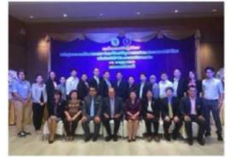
อบรมอาจารย์ที่จังหวัดขอนแก่นโดยเครือข่ายสหกิจศึกษาภาคเหนือตอนล่าง