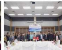
MOU กับสถานพัฒนาฝีมือแรงงานนาขาคี