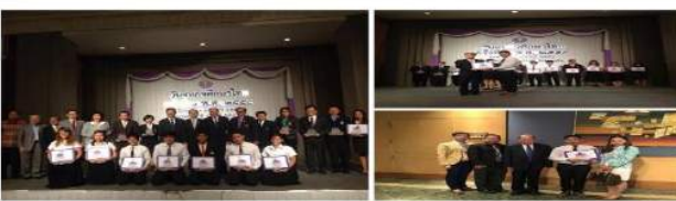
รางวัลโครงการนักศึกษาสหกิจศึกษาดีเด่นระดับชาติด้านนวัตกรรมสหกิจศึกษา ประจำปี 2558 ผู้รับรางวัลมาบรรารณ สังกัดดีโรงเรียน สาขาวิศวกรรมคอมพิวเตอร์ คณะเทคโนโลยีอุตสาหกรรม