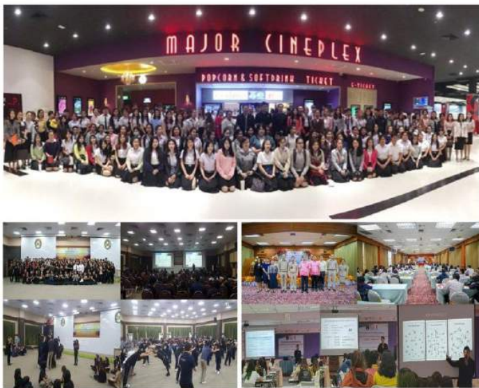
นักศึกษาเตรียมความพร้อมการทำงานโดยสถานประกอบการและแรงงานจังหวัด