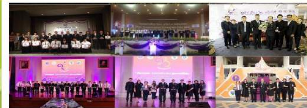
รางวัลผลงานสหกิจศึกษาดีเด่นระดับชาติและระดับเครือข่ายภาคเหนือตอนล่างของมหาวิทยาลัยราชภัฏอุดรดิตถ์