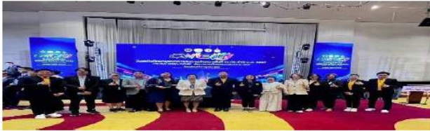
รางวัลผลงานสหกิจศึกษาดีเด่นระดับชาติ ประจำปี 2567 มหาวิทยาลัยราชภัฏอุดรดิตถ์