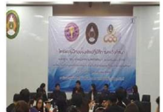
อบรมอาจารย์ที่จังหวัด สกล. สกล. สกล. สกล. สกล.

อาจารย์เข้าร่วมอบรมหลักสูตรคณาจารย์วิทยากรสหกิจศึกษา ตามมาตรฐาน สกส. รัชชช