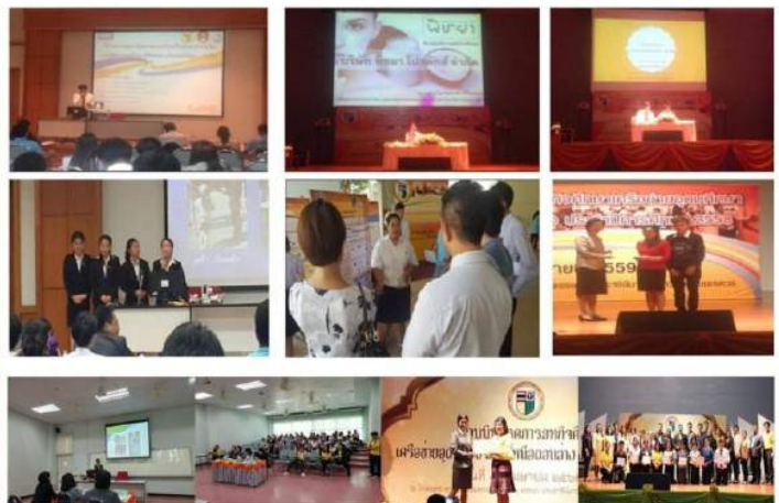
การนำเสนอผลงานสหกิจศึกษาดีเด่นระดับเครือข่ายภาคเหนือตอนล่าง