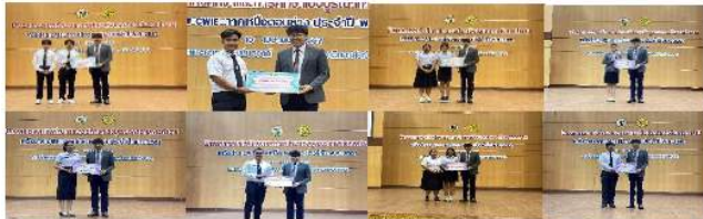
รางวัลผลงานสหกิจศึกษาดีเด่นระดับเครือข่ายภาคเหนือตอนล่างของมหาวิทยาลัยราชภัฏอุดรดิตถ์