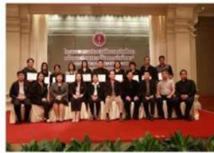
อบรมอาจารย์ที่จังหวัด สกล.

มหาวิทยาลัยราชภัฏอุดรดิตต์ได้มีโครงการดำเนินการดำเนินงานให้ภาคีสถิต และส่งเสริมการพัฒนาความรู้ให้กับคณาจารย์ โดยได้มีการจัดงบประมาณส่งเสริมสนับสนุนอาจารย์เข้าร่วมอบรมหลักสูตรคณาจารย์วิทยากรที่จัดโดยสมาคมสหกิจศึกษาไทยและเครือข่าย ส่งเสริมการพัฒนาสหกิจศึกษาภาคเหนือตอนล่างอย่างพร้อมใจในปี พ.ศ. 2558 - 2560 มหาวิทยาลัยได้จัดโครงการอบรมอาจารย์ วิทยากรสหกิจศึกษา ร่วมกับ สำนักงานคณะกรรมการการอุดมศึกษา เพื่อเพิ่มจำนวนอาจารย์ที่เกษียณสหกิจศึกษาที่เพียงพอกับ จำนวนนักศึกษาที่ออกปฏิบัติงานสหกิจศึกษาเพิ่มขึ้นโดยปัจจุบันมีจำนวนอาจารย์ที่ผ่านการอบรมอาจารย์วิทยากร จำนวน 332 คน คิดเป็น ร้อยละ 84.69 ของอาจารย์ทั้งหมดในหลักสูตรที่มีรายวิชาสหกิจศึกษาครอบคลุมทุกหลักสูตรทุกคณะในมหาวิทยาลัย