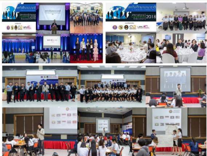
การเตรียมความพร้อมนักศึกษาตามมาตรฐานระดับนานาชาติสำนักงานคณะกรรมการการอุดมศึกษา